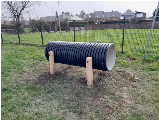
Tunnel buis €1.958,- incl plaatsen