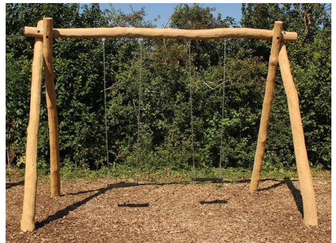
Schommel €2.322,- incl plaatsen