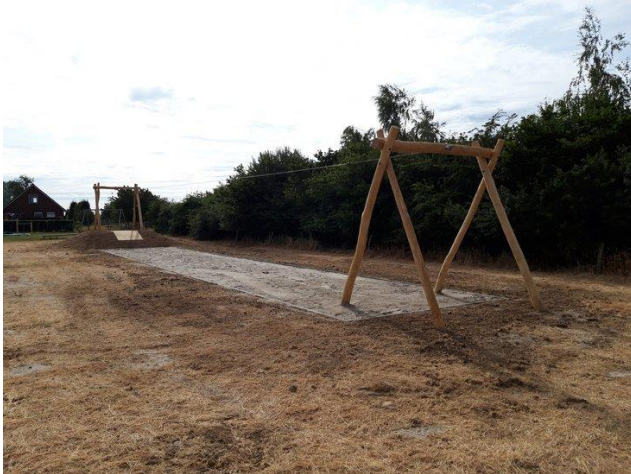
Kabelbaan met startplateau €7.810,- incl plaatsen