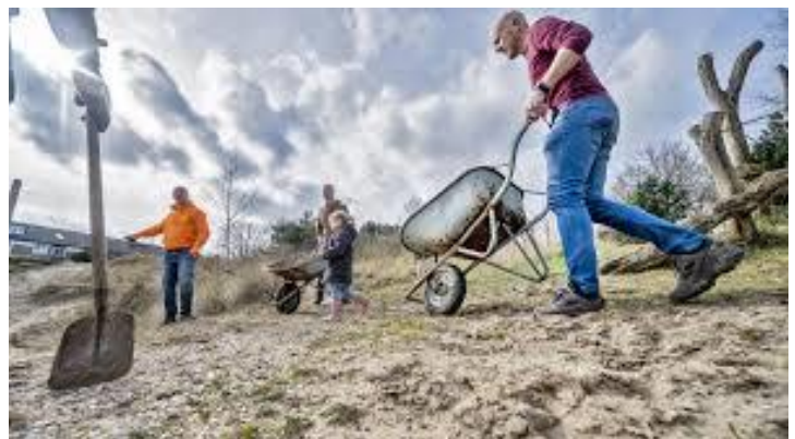
Graafmachine, grondwerk enz. €1.000,-

Overige kosten algemeen Bruine speeltoestellen €1.505,-