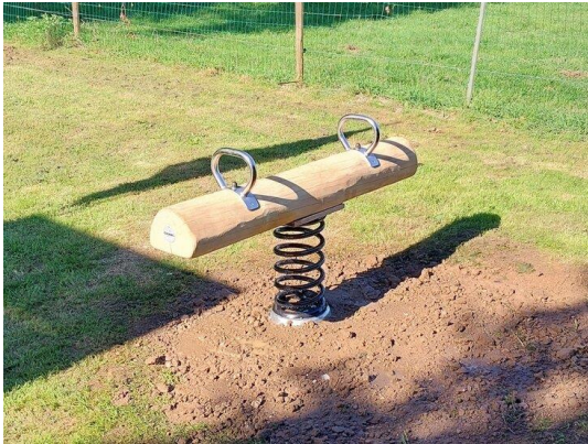
Wipwap €1.522,- incl plaatsen